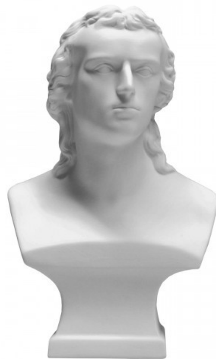
Schiller: Rumalusega võitlevad asjatult isegi jumalad.