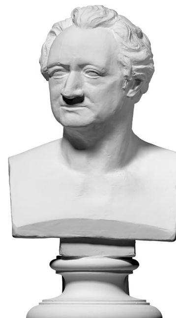
Goethe: Enne kui kõik saab lihtsaks, on kõik keeruline.

Tundub, et juhtkonnal on jäänud tegemata kaks elutähtsat tegu: muuta „Tõde ja õigus II” kohustuslikuks kõigile Treffneri õpilastele, paigaldada aatriumisse väärtkirjanike büstid ning lakke kipsist luik.