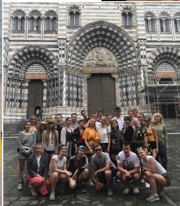
B klass Genovas klassireisil