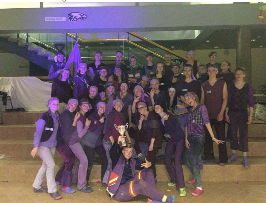
Põlevate silmadega võiduni!