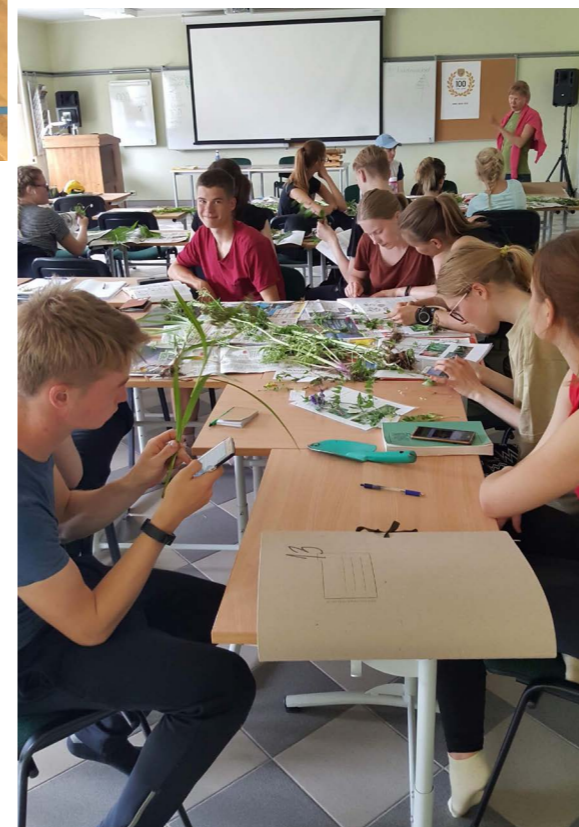
Praktikum: Puhaste kätega ei pääse