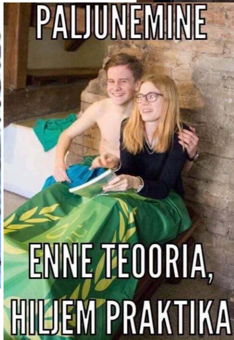
Loodusklassi naljad: lihtsalt haridus