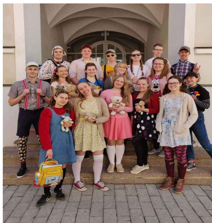
Kirevad tegelased rõõmsate nägude ja värviliste iseloomudega tutipäeval