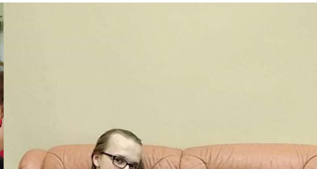
Hetk ristimiselt: õlg öla kõrval kõrgustesse!