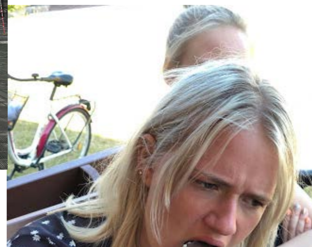
Piilume sõnumitesse: Vestlused klassijuhatajaga on vabad ja lihtsad