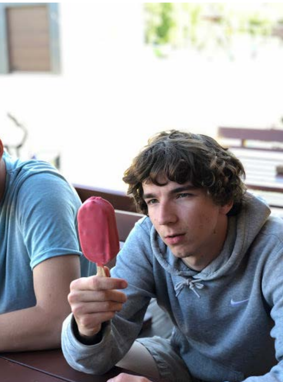
Poliitilised vaated on issanda loomaaias kirjud