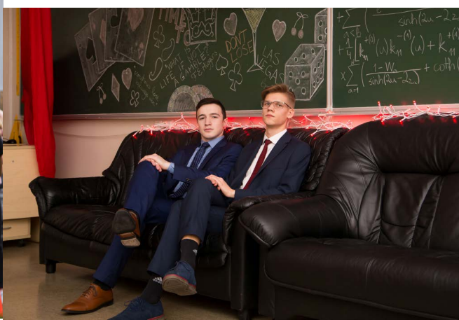
Elegantsed poisid 2017. aasta jõuluballil