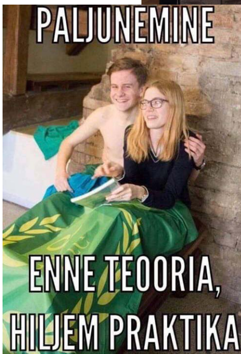
Loodusklassi naljad: lihtsalt haridus