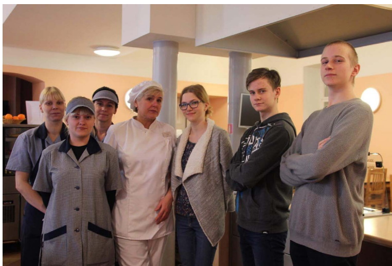
Pilt kooli armastatuid isikute, Toidutorni kokkadega