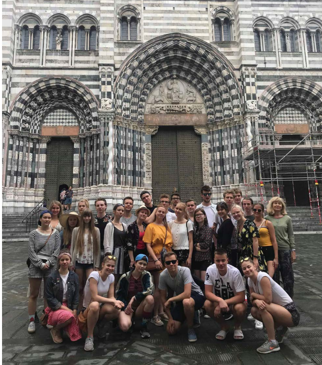
B klass Genovas klassireisil