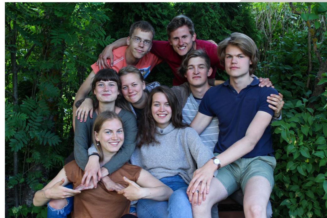
Miilangu raskerelvastus: esmakordsest tutvumisest eluaegse sõpruseni.

Ja siis, õhtu hämardudes, saabus minut, kui kõik pastaka paberile poetasid ning üksteisele heldinult silma vaatasid. Värsked semud tundsid, et nende ümber on hea energia, head inimesed ja ees on priimad ajad. Tulemas olid nende elu parimad aastad.