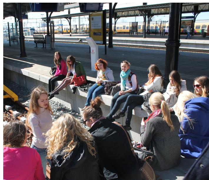
Väike paus: eestlased raudteejaamas jalgu puhkamas

Esimesena võtsid teekonna ette hollandlased ja külastasid Eestit. Ilmselt suurimaks üllatuseks oli meile nende imelikud söömisharjumused. Hommikul sõid nad saia, lõunaks eelistasid nad saia ja õhtul soovisid midagi suurt