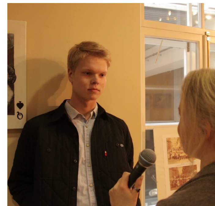
Värsked vestlejad: noored üllatasid müütidega.

Ka Treffneri pikaajalised traditsioonid olid tuntud, kõige enam ball ja kardedut rebaste ristimine. Huvitegevustest mainiti bridžiklubi, huviga räägiti ka Facebooki loodud uute rebaste gruppidest ning sinna postitatavatest tutvustustest ja tulevaste koolikaaslaste kommentaaridest. Teati ka rääkida, et õpilasesindus on aktiivne ja et puudumiste ja hilinemistega nalja ei ole. Kokkuvõttes oli tagasiside väga positiivne. Ometi peame arvestama, et küsitlesime noori, kes tõepoolest tahavad ülekõige meie koolis õppida ning on uurinud kooli kohta eelnevalt infot. Mina jäin aga rahule: pole need jutud nii hullud midagi ja kuuldused on vist pigem head.