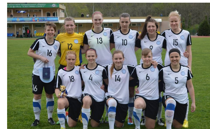
Rõõmsad jalgpallurid: suud olid alatasa naerul

Kogu üritus oli ülimalt tore ning me saime avardada oma silmaringi ja täiendada kogemustepagasit nii jalgpalli kui ka kultuuri võrra. Kuigi on hea olla tagasi oma kodus, lahusime kõik väga raske südamega ning juba pikki silmi järgmist aastat ootama jäädes.