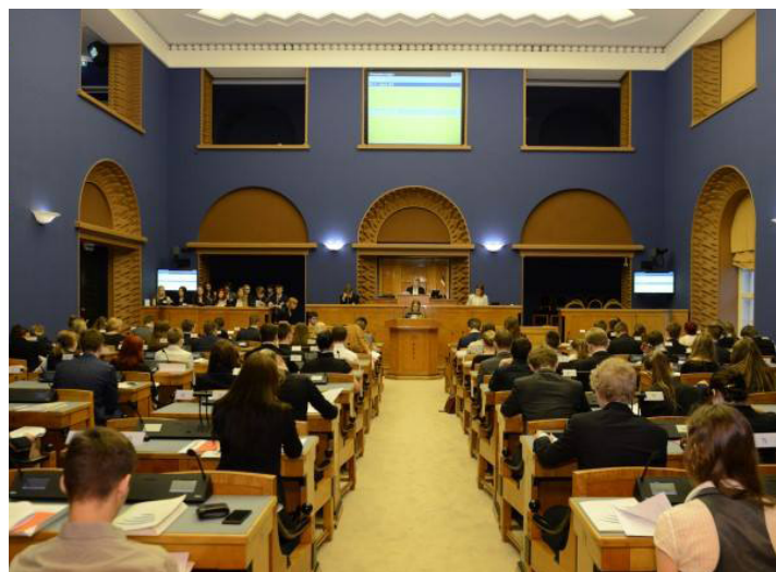
Üldkogutööhoos: esmaspäeval otsustatakse kõik.

Isikliku kogemuse põhjal soovitan kindlasti Mudel-Euroopa Parlamendis osalemist; lisaks tööle toimub seal ka palju muud vahvat ja toredat (kuiva poliitilise töö kõrvalt). Näiteks on iga pooleteise tunni järel kohvi- ja puuviljapaus - äärmiselt kosutav! Tööd tehes ei panegi tähele seda, kui kiiresti oma komisjoniga ühtesulandumine toimub. Ühine keel leitakse äärmiselt kiiresti ja peaaegu märkamatu. Samuti sain kogemuse osaleda rahvusvahelisel sessioonil MEP BSR (Baltic Sea Region) - sinna kogunesid noored peaaegu kümnest riigist. Sain palju uusi sõpru välismaalt, värskeid teadmisi teiste riikide kohta ning äärmiselt kasulikku inglise keele praktika. Mina soovitan julgelt kõigile, keda natukenegi huvitab maailmas toimuv, võtta osa Mudel-Euroopa Parlamendi üritustest!