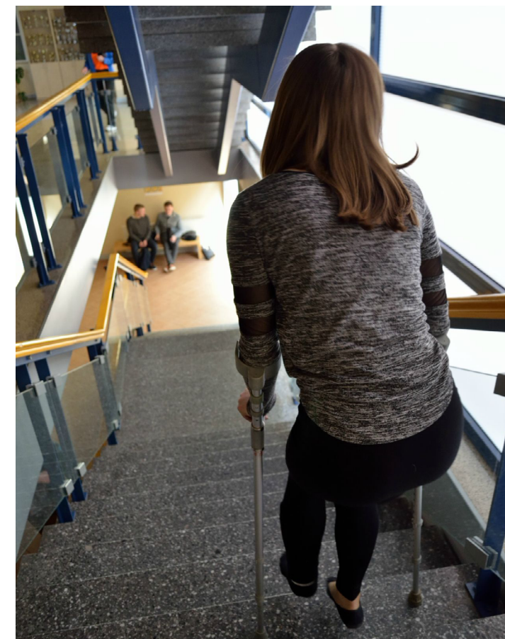
Kargutaja õudus: Treppe mööda liikumine on ebamugav endale ja teistele.

Minu praegune olukord tekitas aga huvi ja küsimusi kooli lifti suhtes. Liftišaht on meil olemas, aga lifti ennast pole. Mina sain küll ühe terve jala ja paari terve kättega karkude peal liikudes õnneks hakkama, aga kuidas liikleks meie koolis ratastoolis inimene?