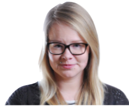
TEKST LAURA POROVART

Pärast kolme aastat Treffneri seinte vahel õppimist ning klasside vahel saalimist on abiturientid päris kindlad, et just nüüd ja täpselt nüüd on nad piisavalt targad ja kogunud, et lasta neil minna. Viisime läbi veel viimase tunnikontrolli, et selles ka ise veenduda.