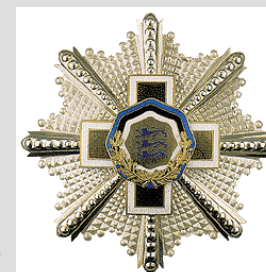
Uhke orden: Valgetähe teenetemärk.

Valgetähe V klassi teenetemärk – Hele Kiisel, 23.02.2012 Valgetähe IV klassi teenetemärk – Ott Ojaveer, 23.02.2009 Valgetähe IV klassi teenetemärk – Aime Punga, 23.02. 2005