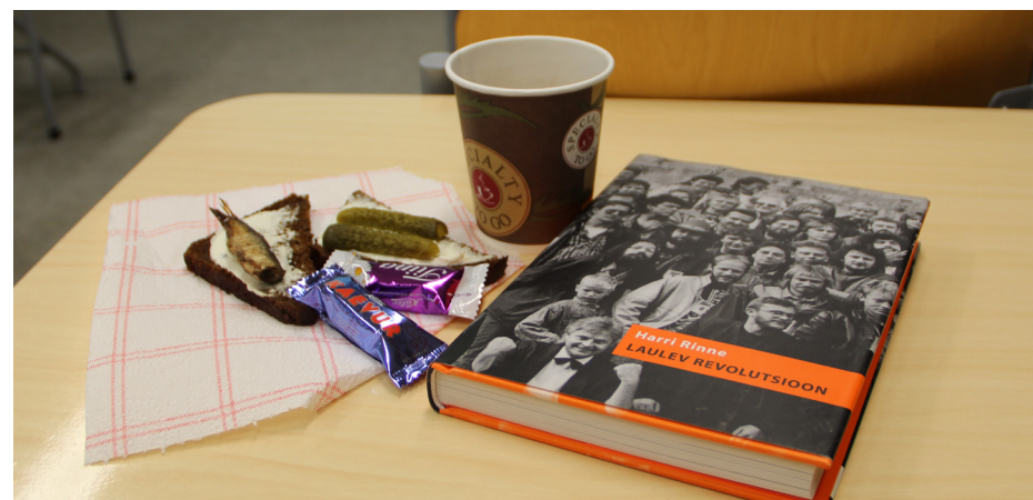
Pakuti head-paremat: Kiluvõileivad, hapukurk, eesti kommid ja tee.

noorpõlve diskokogemusi. Jätkasime Alo Mattiiseni kuulsa viie teosega. Tekkis mõnusalt ülev tunne, peaaegu nagu oleks laulupeol olnud. Tolleaegsed muusikud on julgenud neis lugudes välja öelda seda, mida poliitikud poleks iial sõandanud valjult lausuda. Avastasime koos, et sõnad ja muusika võimendavad emotsioone. Emotsionaalne mälu aga sealjuures on ikka selgem kui ratsionaalne.