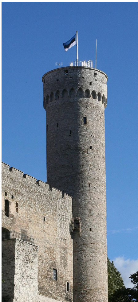
Pikk Hermann: Lippu heisates kõlab Eesti hümn.