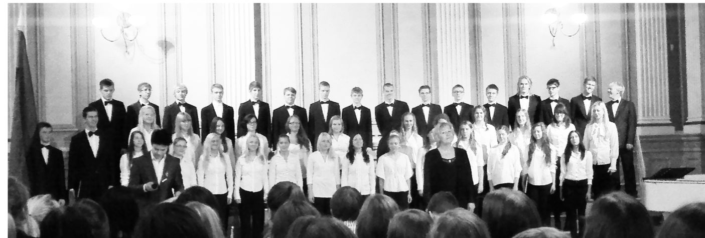
Kontsert möödus viperusteta: Esinemisel ei unustanud keegi laulusõnu ega kukkunud lavalt alla.